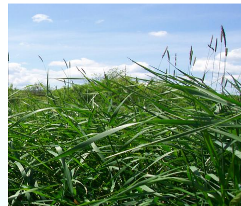
Korrja e vonua: më pak qumësht 625 lit

Kg qumësht nga një ton i foragjereve të kositura*: Kositja të bëhet kur fillon formimi i kokërzave të vogla, para se të fillojnë të rriten.