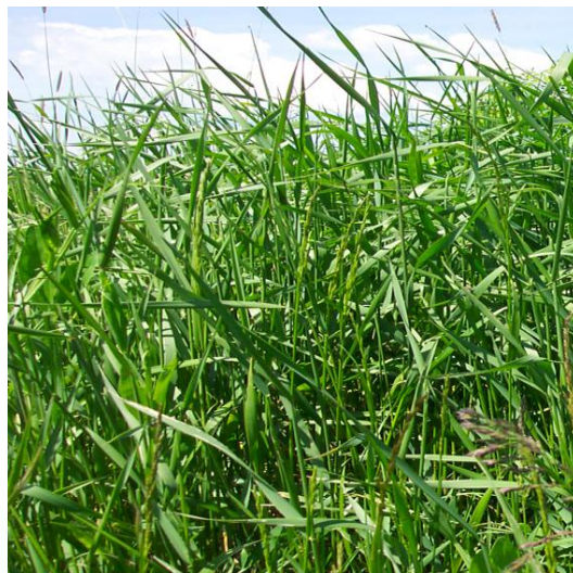
Korrja në kohën emergjente 1,330 lit qumësht

Kg qumësht nga një ton i foragjereve të kositura*: Kositja të bëhet kur fillon formimi i kokërzave të vogla, para se të fillojnë të rriten.