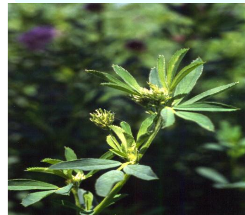
Korrja në kohën emergjente – 1450 kg

Kosite tërfojën alfalfa kur sythat kanë dalur por ende nuk është krijuar lulja.