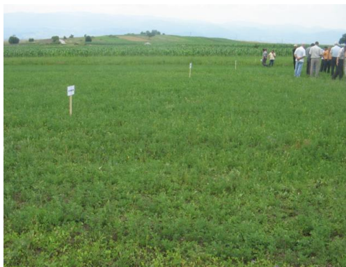
Varietet i ri i testuar i jonxhes (Erba Medica)