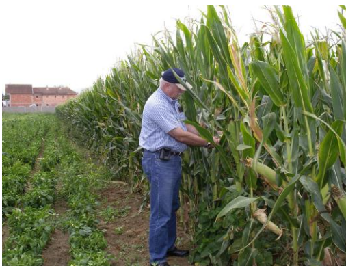
Pas jonxhes nëse mbillet misri, luledielli ose grurë rendimenti do të jetë më i lart

Misër (qoftë drithë ose silazh) dhe grurë 10 deri 15% krijon më shumë prodhim pas jonxhes sesa pas kultivimit të vazhdueshëm te kulturave tradicionale (Miser –grurë etj ).